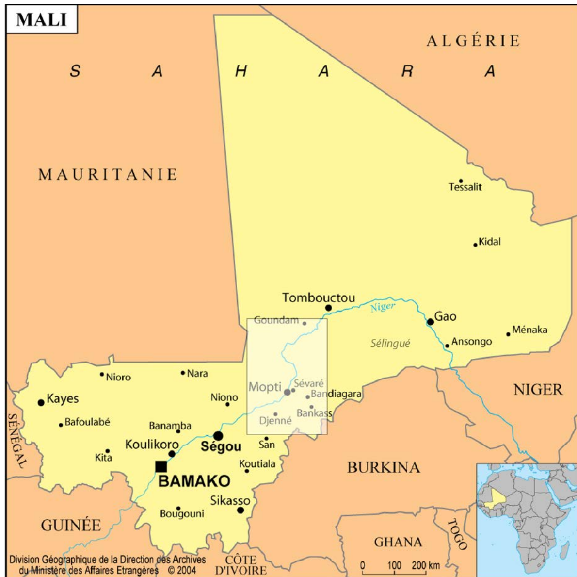
Figure 1 : Carte générale du Mali et localisation grossière de la zone du Delta Central du Niger (DCN).