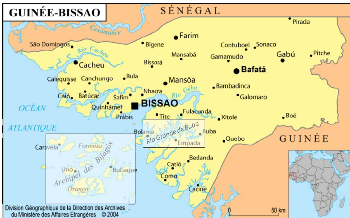
Carte générale de Guinée-Bissau et localisation des deux zones étudiées lors de la campagne de 1993 : l'archipel des Bijagos et le Rio Grande de Buba.