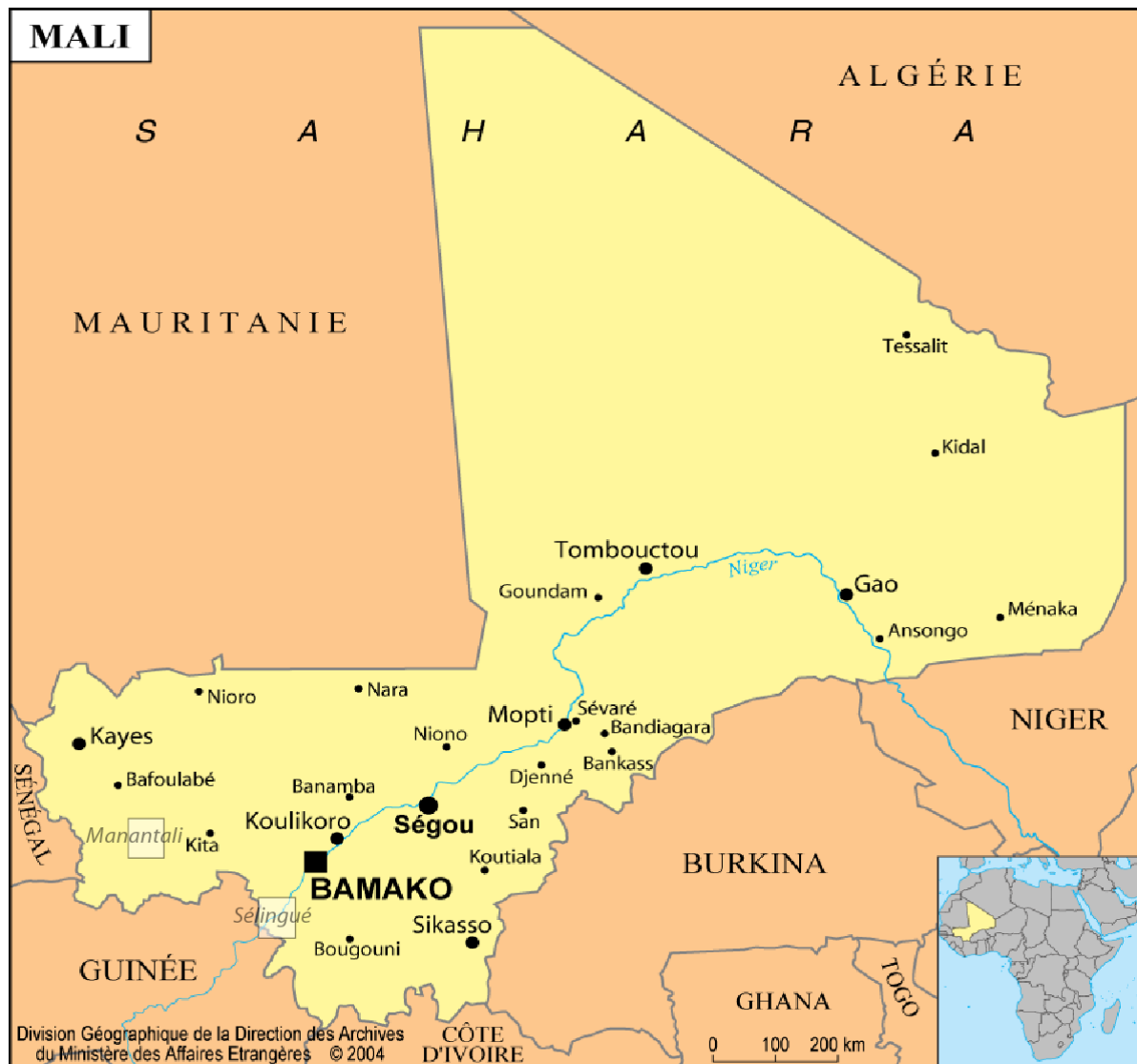
Figure 1 : Carte générale du Mali et localisation des deux lacs de barrage étudiés en 2002-2003 Manantali et Sélingué.